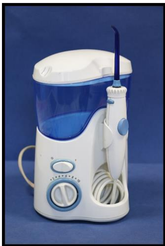
«واترجت و نحوه استفاده از آن»